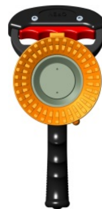
Ci nienie PSI bar

Standardowo w komplecie z nowym otokiem głowicy, posiadającym oznakowanie w postaci wypukłej linii prostej dla strumienia zwartego oraz wypukłej litery V dla strumienia rozproszonego. Doskonale rozwiązanie w warunkach ograniczonej widoczności.